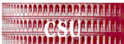
Cultures et sociétés urbaines